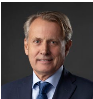
Anders Sundström (1952) Fil. kand.

Styrelseordförande i Kaunis Holding, NMI Group, Hedlunda Industri AB och Ekhaga AB. Tidigare bl a styrelseordförande i Swedbank och KF. Mångårig operativ erfarenhet inom såväl industrin som den finansiella sektorn, bl a som verställande direktör för Folksam. Flera ministerposter och andra politiska uppdrag.