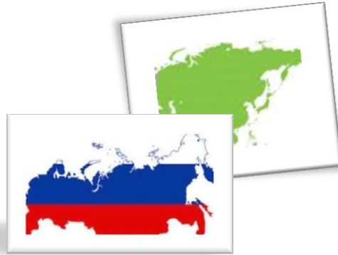
Asienkrisen + Ryssland