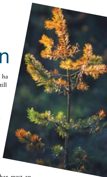
Gremmeniella, en skottdödande svamp, drabbar främst yngre träd.