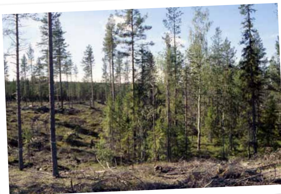
Kantzon vid myr

Naturvärdesträd i form av gamla tallar med platta kronor och/eller pansarbark, grova aspar och alla sälgar och rönnar lämnas därför vid avverkningen.