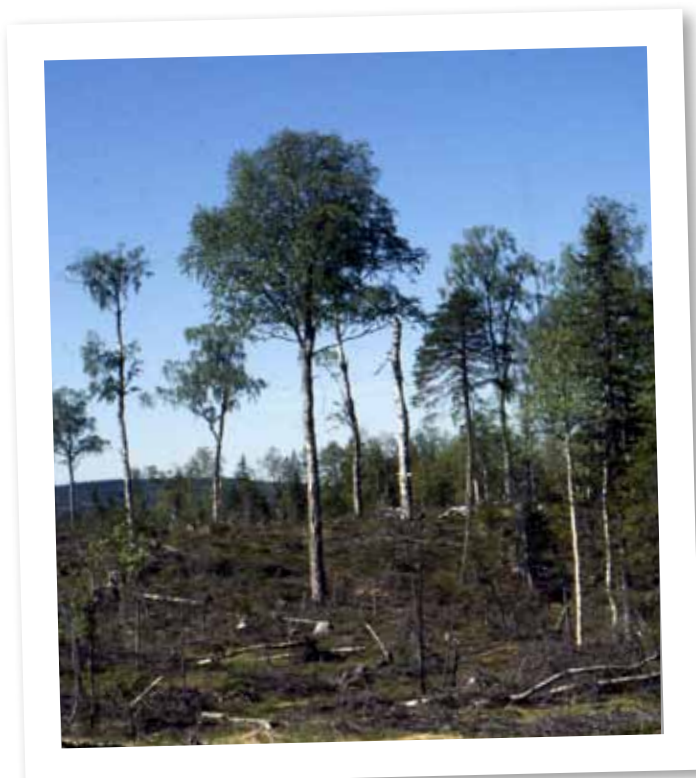
Björkar på hygge